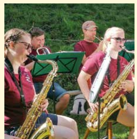
Verschiedene Musikgruppen sorgen auf den Hütten für Stimmung.

ihre Zuhörer mit schwungvollen Melodien unterhalten. Die Hüttenwirte sorgen dafür, dass den Besuchern auch kulinarisch nichts abgeht. Die Organisatoren hoffen, an diesem Tag viele Frastanzer zu treffen. Der Eintritt zu diesen Veranstaltungen ist frei. Allerdings kann „Musik auf allen Hütten“ nur bei trockener Witterung durchgeführt werden. Bevor man sich auf den Weg macht, lohnt sich ein Blick ins Internet: Musikbegeisterte Wanderer finden auf www.frastanz.at aktuelle Wetter-Infos sowie das detaillierte Programm.