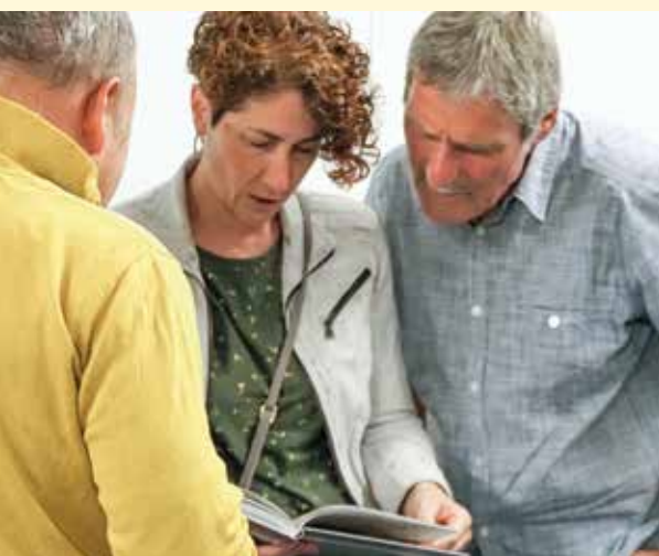
Das neue Buch wurde gleich an Ort und Stelle eifrig studiert.

wunderten sich nicht selten, an welcher geschichtsträchtiger Adresse sie zuhause sind.