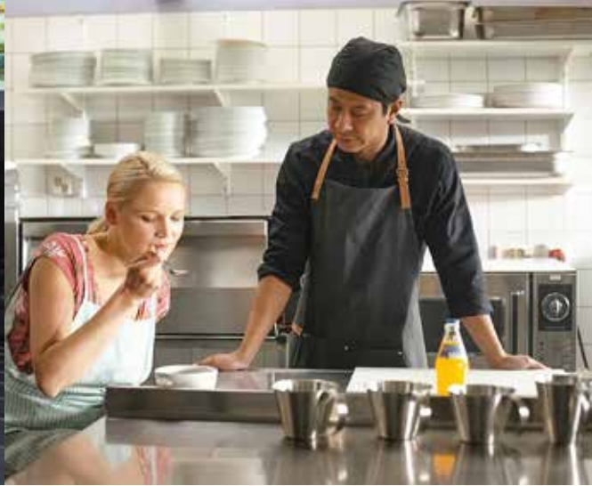
„Master Cheng in Pohjanjoki“ beschloss die neunte Saison von „Kino vor Ort“ in Frastanz.