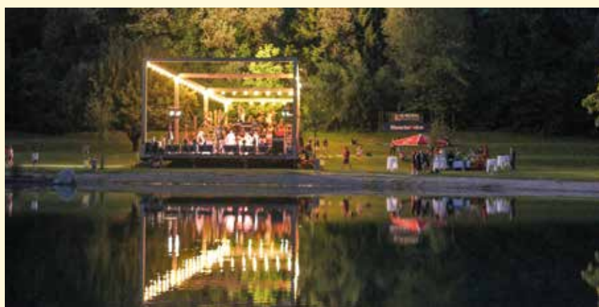
Abends präsentiert sich der Kultursteg am Badensee in der Unteren Au besonders stimmungsvoll.

Nach der Sommerpause will der Verein mit Lesungen, einer Kunstinstallation und anderen Ideen weitere kulturelle Akzente setzen.