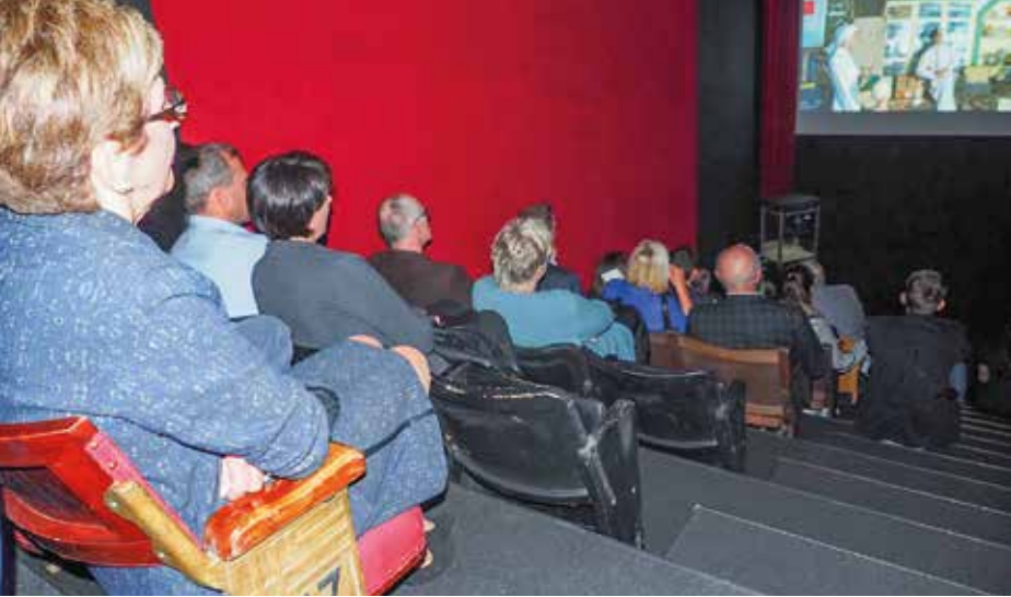
Das nostalgische Kino in der Vorarlberger Museumswelt bietet ein ganz besonderes Film-Erlebnis.