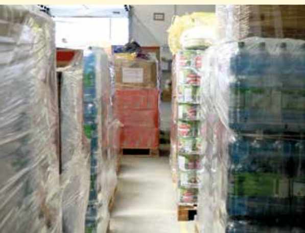
In der ehemaligen Fabrikhalle stapelten sich die Hilfsgüter.