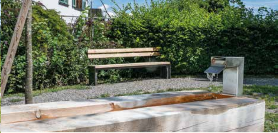
Der Lindenplatz verspricht an heißen Tagen Abkühlung für Mensch und Tier.