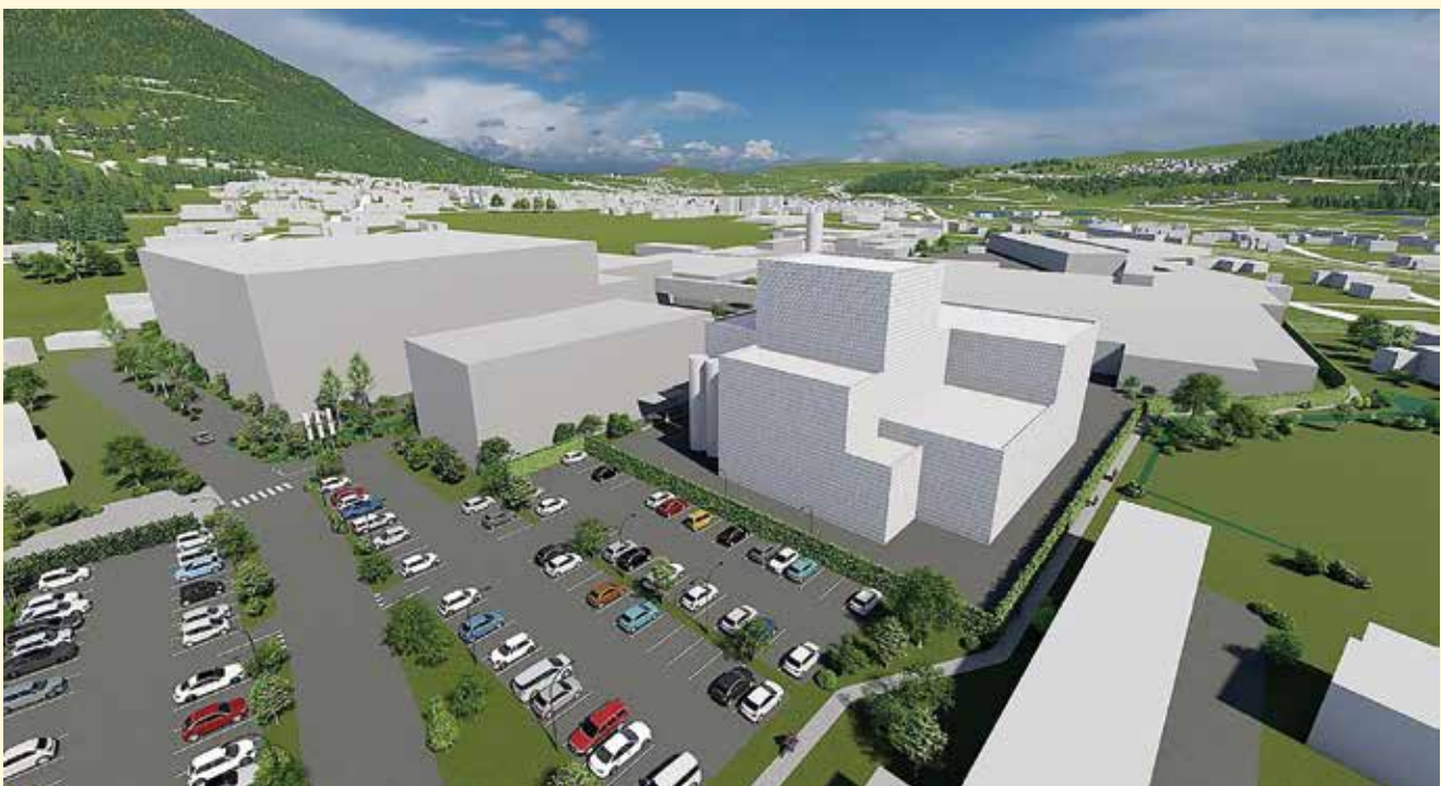
3.600 Quadratmeter Fläche werden für das Kraftwerk benötigt: Es wird auf dem Rondo-Firmengelände errichtet (bisher ein Parkplatz).

Frastanz noch nicht erfasste südliche Ortsteil der Marktgemeinde erschlossen werden. Bis zu 500 Haushalte könnten dann ihre Öl- und Gasheizungen abschalten. E-Werke Geschäftsführer Rainer Hartmann sieht das Projekt daher positiv. Das Wärmenetz leiste einen wichtigen Beitrag für den Klimaschutz. „Als Eigentümerin und Betreiberin der Biowärme Frastanz möchten wir unser Angebot laufend verbessern und möglichst viele weitere Objekte anschließen“, erklärte er bei der Pressekonferenz.