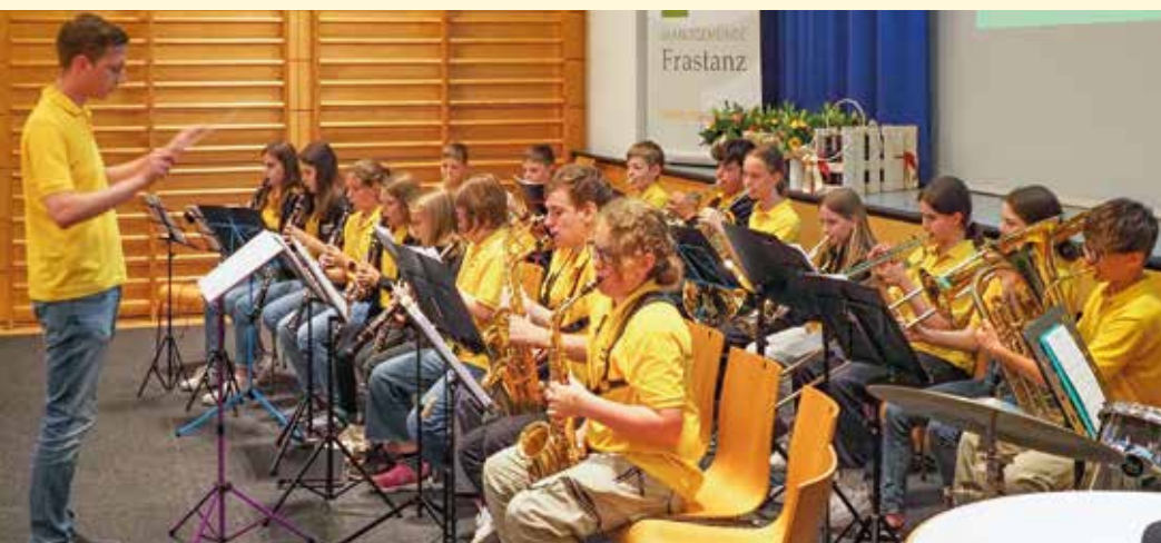
Die Jungmusik und der Trachtenverein unterhielten die Jubilare mit schwungvollen Beiträgen.

ser Runde feierten den 90. Geburtstag. Außerdem gratulierten die beiden dreizehn Frastanzer Paaren zur Goldenen Hochzeit. Diese Männer und Frauen sind bereits seit 50 Jahren miteinander verheiratet. Drei weitere Paare haben sich sogar schon vor 60 Jahren das Jawort gegeben. Diesen Diamant- und Goldpaaren sowie den Altersjubilaren durften die Ortpolitiker auch kleine Geschenke und Urkunden des Landes Vorarlberg übergeben. Ein feines Abendessen, das vom Catering-Team der Aqua Mühle Vorarlberg fachkundig zubereitet und serviert wurde, rundete diesen geselligen Festabend genussvoll ab.