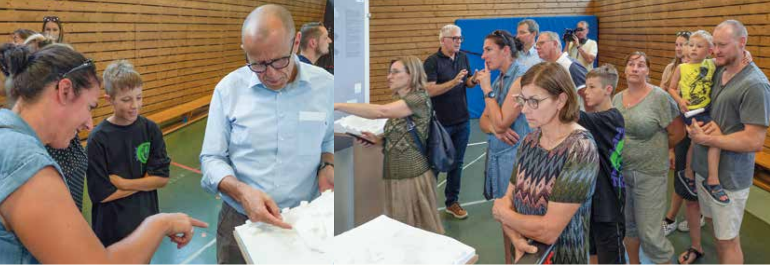
Am 14. Juli wurden alle 18 Projekte präsentiert und mit viel Interesse begutachtet. Das Siegerprojekt stieß auf viel Zustimmung.