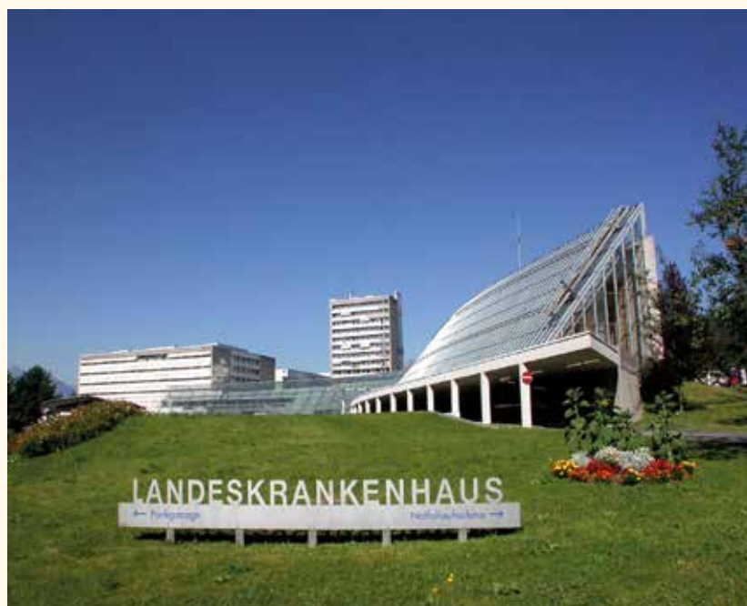
Die Betreuung der Patienten in den Landeskrankenhäusern ist im internationalen Vergleich Spitze: Die Kosten dafür steigen allerdings jedes Jahr...

In Summe hatte die Marktgemeinde Frastanz für diese beiden Fonds also über drei Millionen Euro zu berappen – allein die Mehrkosten gegenüber dem Vorjahr schlugen mit fast 260.000 Euro zu Buche.