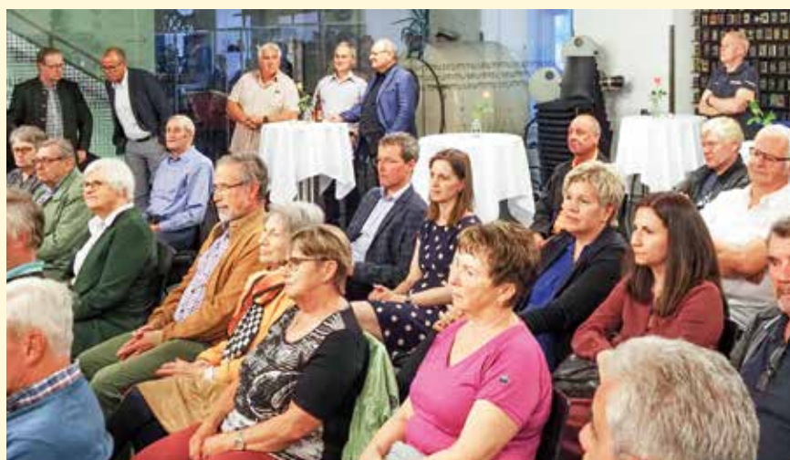
Zahlreiche Besucher folgten den Ausführungen des Autors.