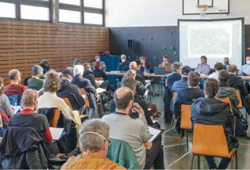
In der Volksschul-Turnhalle wurden die für den Wettbewerb zugelassenen Planer Anfang März über das Projekt informiert.