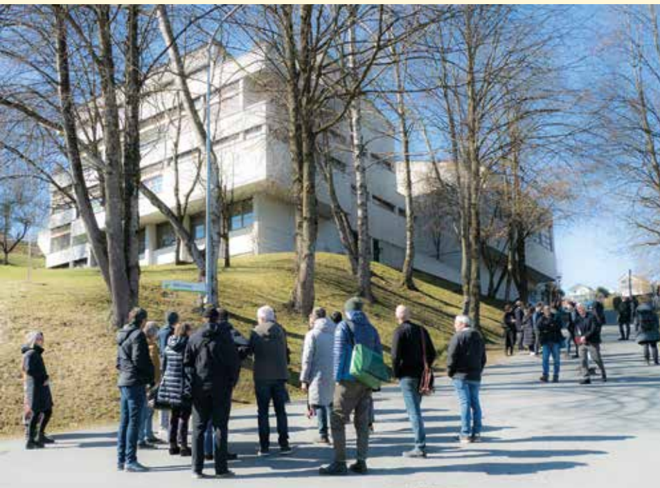
Die Architekten nahmen sich ausgiebig Zeit, um den Bestand und das Planungsareal ausgiebig zu besichtigen. Das neue BiZ soll schließlich auch in die Umgebung „passen“.

Alle Arbeiten zum Wettbewerb und dessen Ergebnis wurden am 14. und 15. Juli direkt in der Schule in Fellengatter der interessierten Öffentlichkeit präsentiert. Jetzt werden die Wettbewerbssieger mit der Detailplanung beauftragt. Mit dem Bau könnte im Jahr 2024 begonnen werden.