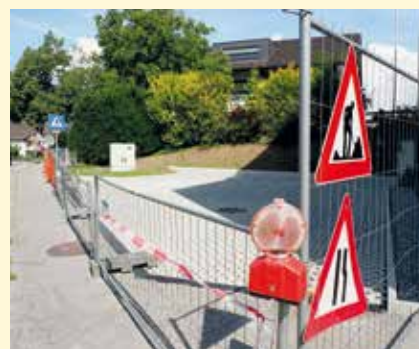
Neben der Raiba entsteht ein Parkplatz samt Ladestationen für E-Autos.

Insgesamt investiert die Marktgemeinde rund 135.000 Euro brutto für diese Maßnahmen. Die Aufträge wurden an die Best- und Billigstbieterin, die Baufirma Gort, vergeben.