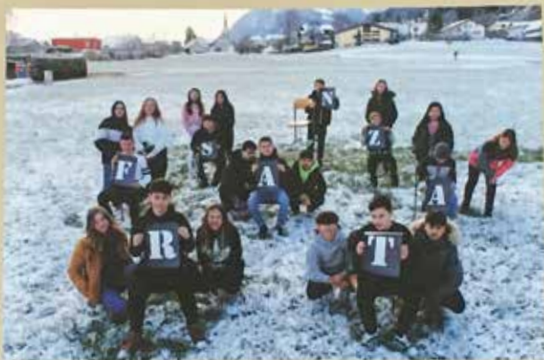
Ein literarischer Frastanz-Guide – 24 Jugendliche der Neuen Mittelschule Frastanz präsentieren ihre Lieblingsplätze