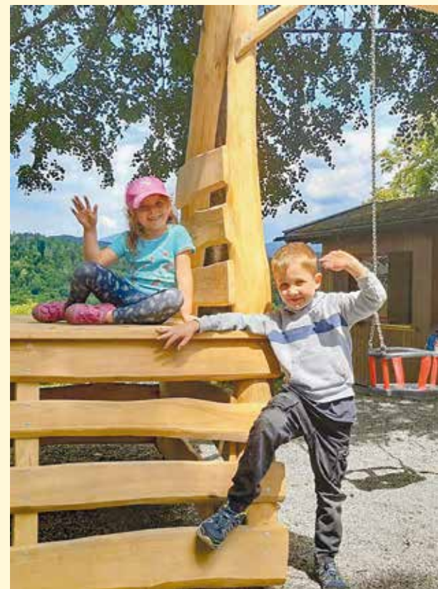
Der Spielplatz „Auf der Bleiche“ ist jetzt noch attraktiver und ständig für alle Kinder geöffnet.

Im Gemeindepark wurde das Spielangebot ebenfalls deutlich erweitert. Nach Abschluss der Bauarbeiten für den Saminapark wurde bereits im Herbst eine Bocciabahn angelegt. Erst kürzlich haben außerdem ein neues Federtier und ein Sandbagger Einzug gehalten, die vor allem bei den Jüngsten hoch im Kurs stehen. Die größte Attraktion ist aber das neue Baumhaus, welches von den Mitarbeitern der Aqua Mühle Vorarlberg mitten im Park aufgestellt wurde. Besonders schätzen die Kinder, dass sie dieses Versteck bequem über die Rutsche