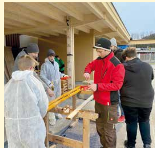
Bei der Sanierung des SV-Clubheimes halfen alle mit.

Über 1300 Arbeitsstunden leisteten die freiwilligen Helfer. Die ehrenamtliche Arbeit der Vereinsmitglieder hat nicht nur die Baukosten um einiges gesenkt - und dadurch das Projekt in dieser Form erst möglich gemacht. „Die Zusammenarbeit der