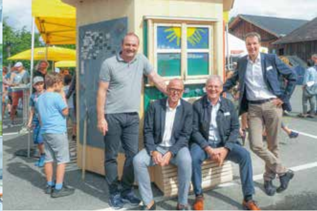
Der von den Kindern gestaltete Begegnungs-Pavillon fand nach der offiziellen Eröffnung im Gemeindepark eine dauerhafte Bleibe.