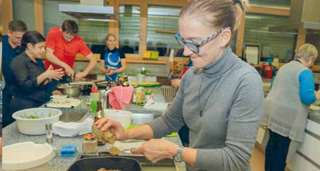
Gemeinsam macht das Kochen besonders viel Spaß.