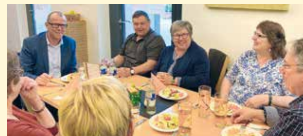
Am 6. März wurde der Senioren-Mittagstisch gestartet.

lecafé (Tel: 0522/51596120) oder in der Bürgerservice-Stelle im Rathaus (Tel: 0522/51534) anmelden.