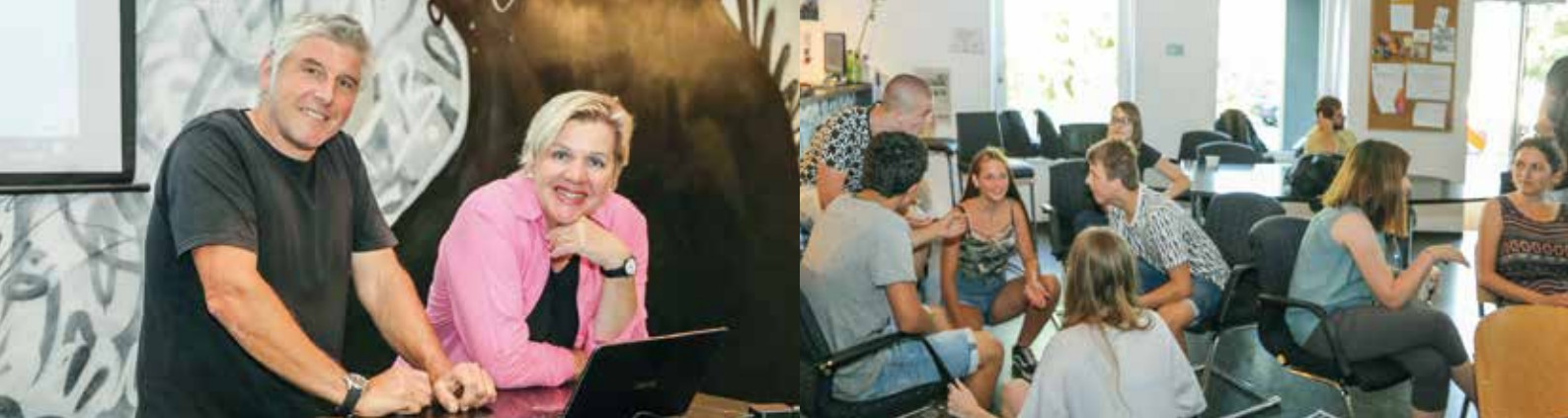
Rund 70 Jugendliche diskutierten mit den Gemeindeverantwortlichen und brachten Ideen ein.