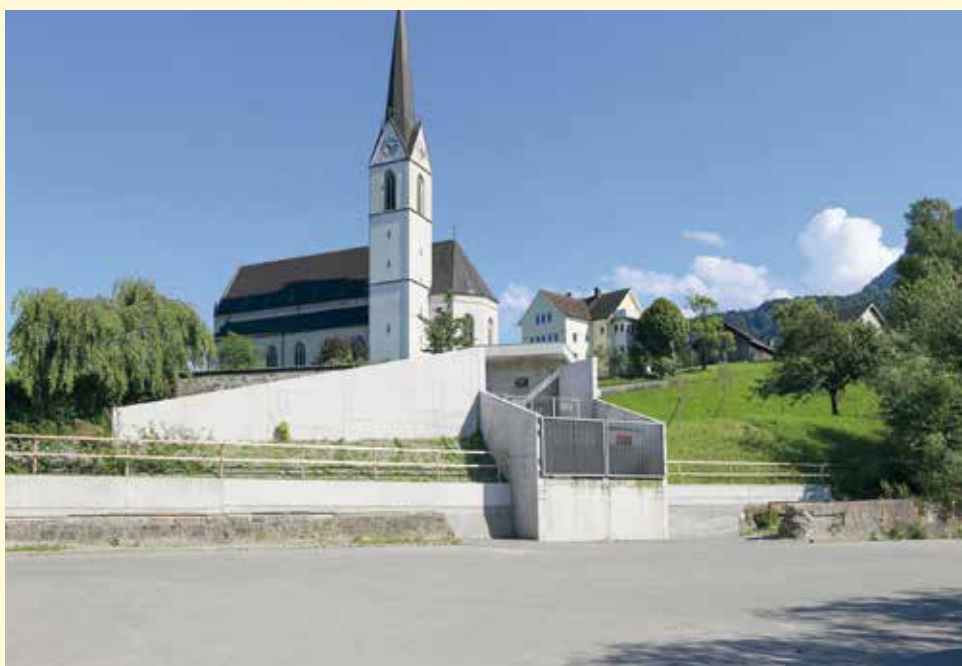
Der Skaterplatz soll nach den Vorstellungen der Jugendlichen umgestaltet werden.

Markus Burtscher wird nun versuchen, in den weiteren Planungen möglichst viele der Ideen der Jugendlichen aufzugreifen, damit ein möglichst breites Angebot entsteht. Als erfahrener Skater wird ihm Linus zur Seite stehen, damit Funboxen, Miniramps und andere Skatingelemente optimal integriert werden. Geht alles nach Plan, soll der neue Outdoor Fun Space im Laufe des nächsten Jahres eröffnet werden.