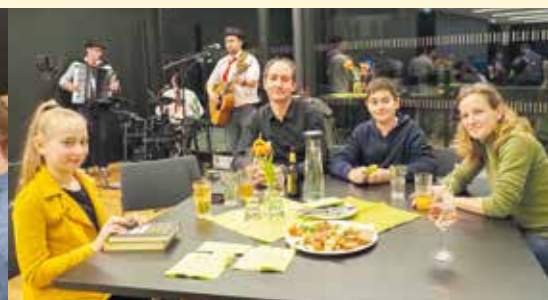
Nach der offiziellen Feier gab es noch Gelegenheit zum gemütlichen Plausch.