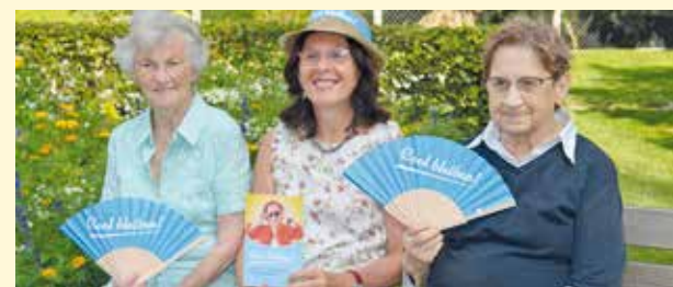
Das Motto lautet „grüschit si“ und „cool bleiben“.

Gemeinde Orte ausfindig gemacht, an denen man im Schatten, an Brunnen oder Kneippanlagen „cool bleiben“ kann. Die Broschüre ist kostenfrei im Bürgerservice des Rathauses beziehungsweise als Download unter www.frastanz.at erhältlich.