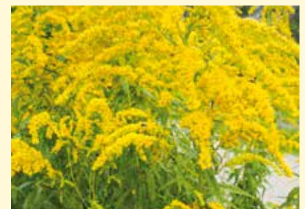
Die Goldrute gehört zu den Invasoren, welche die Vielfalt im Ried bedrohen.