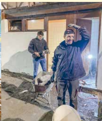
Oft wurde bis spätabends gearbeitet.