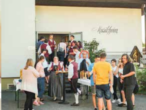
Der Musikverein erhält im Untergeschoss des Bildungszentrums Hofen neue Proberäume.