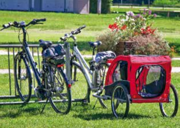
Frastanz setzt stark auf umweltfreundliche Mobilität.