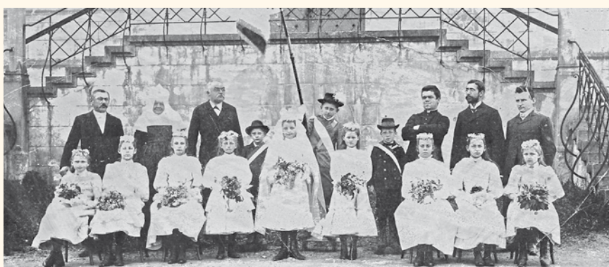
Weihe der Schulfahne am 12. April 1909

Nach Einführung der Schulpflicht fand der Unterricht im zentral gelegenen Tanzhaus statt. Dieses war zwar überdacht, aber nach allen Seiten offen. Deshalb wurde 1783 eine Schulstube und 1801 ein weiteres Schulzimmer eingebaut. Die beiden Klassen waren für insgesamt 90 bis hundert Schüler gedacht. Die Frastanzer Bevölkerung wuchs in den Jahren 1819 bis 1830 um 245 Personen auf insgesamt 1424 Einwohner an. Dies wirkte sich auch auf die Schülerzahlen aus. 1830 lebten im Ort 150 Schüler. Ein Neubau wurde deshalb unumgänglich. Weil die Tanzlauben zudem immer wieder Schauplatz von allerlei nächt-