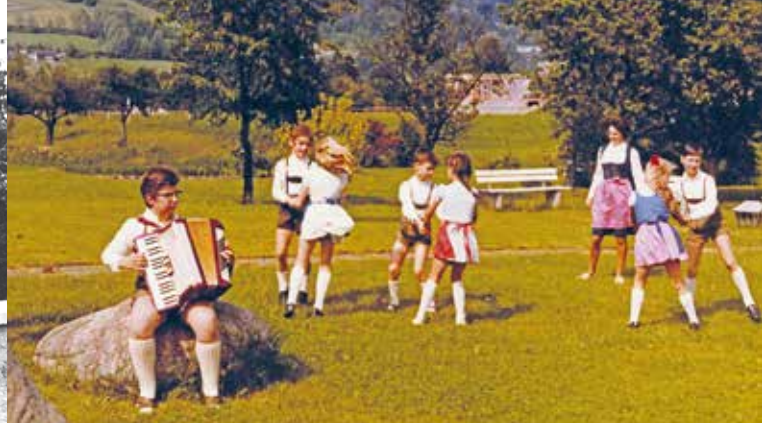
Lehrerausflug 1954 auf den Pfänder, Tanzunterricht an der Volksschule.