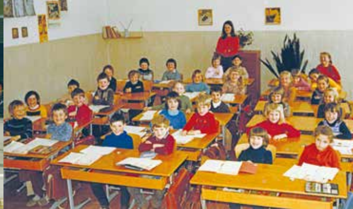
Fahrradprüfung und Schulklasse aus früheren Jahrzehnten.

festigen, wurde dann im lauten Klassenchor das 'Grüß Gott Herr Schuldirektor' eingeübt.