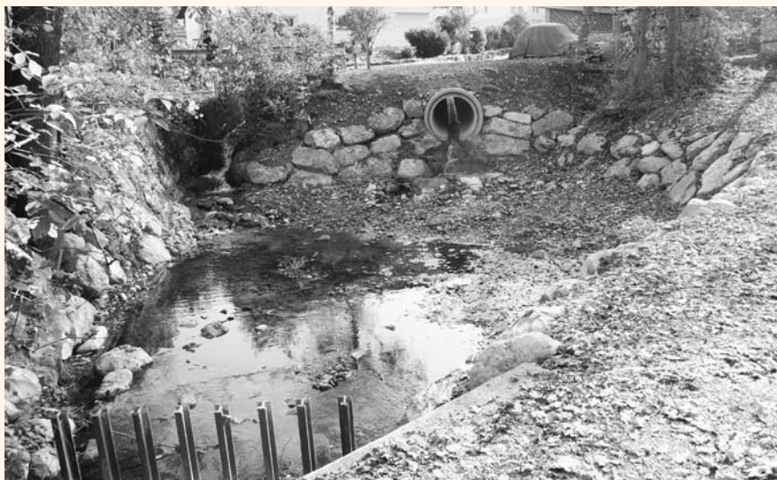
Der Geschiebefang nimmt rund 330 Kubikmeter Schotter auf.

Insgesamt werden die Maßnahmen am Mariexbach rund 280.000 Euro kosten.