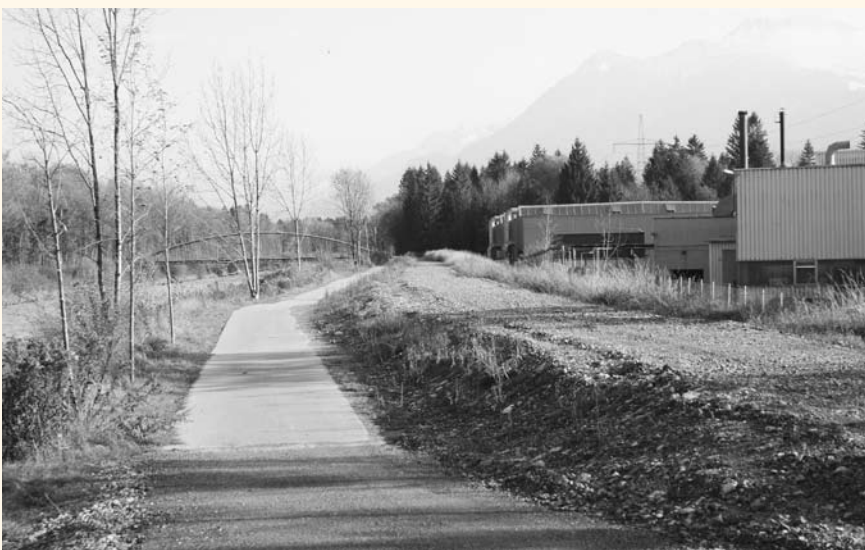
Der Radweg soll im Bereich der Firma Müroll direkt auf den Damm.

Auf Höhe der Firma Müroll wurde außerdem bereits ein 340 Meter langer Schutzdamm errichtet. Ursprünglich sollte der Radweg parallel dazu geführt werden. Stattdessen haben sich die Planer nun dafür ausgesprochen, den 3,5 Meter breiten Radweg direkt auf der Dammkrone zu errichten.